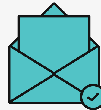
Tecnológica e Digital

Para cada dimensão, indicamos os objetivos traçados e as ações necessárias à sua concretização, que podem ser avaliadas por meio de indicadores de desempenho. Uma vez analisada a situação real do AE em cada uma das seções, estabelecemos uma série de objetivos a serem desenvolvidos para melhorar a competência dos membros da comunidade educativa: professores, alunos e famílias.